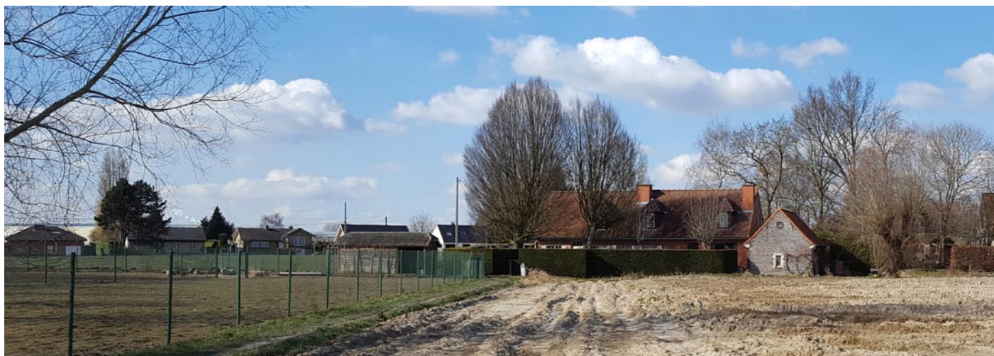
Situatie in 2018