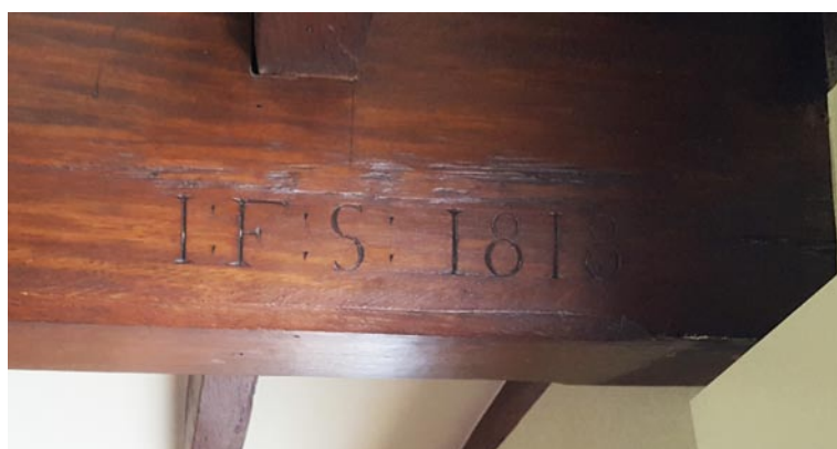
Op de moerbalk staat het bouwjaar 1818 gebeiteld